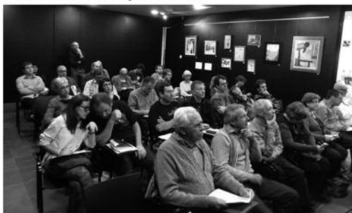
Públic de l'anterior Trobada, celebrada a Ripoll

Esterrí d'Àneu serà el poble escollit per a l'11a edició d'aquestes trobades, que se celebraran el proper cap de setmana del 25 al 26 d'octubre, i que pretenen establir llaços de comunicació entre Andorra i els seus veïns del sud.